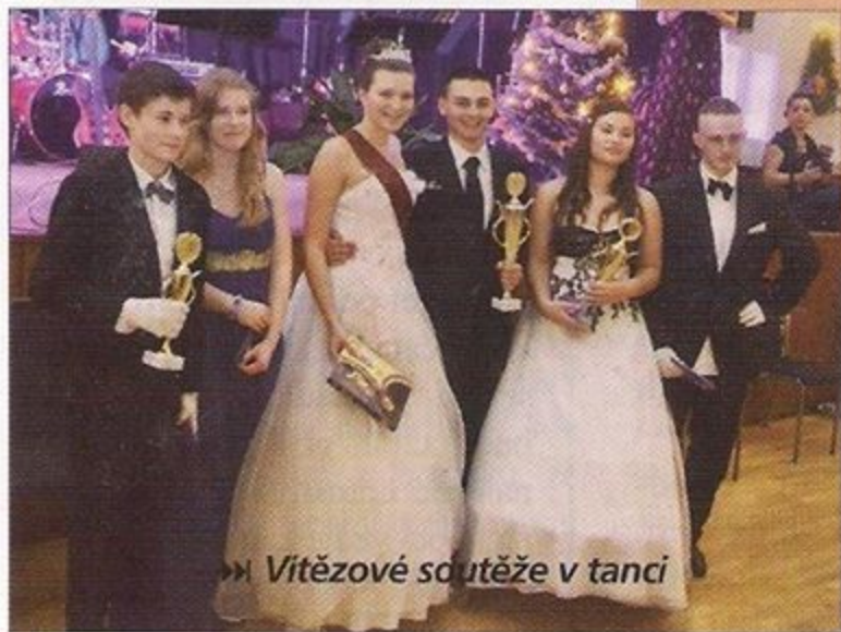
» Vítězové soutěže v tanci

ci zhlédli několik ukázek tanečních vystoupení, nechyběla taneční soutěž o Pohár společenského klubu i volba Miss. Jako novinku letošního kurzu představili organizátoři profesionální fotostudio, které poskytlo zájemcům fotografie na počkání. Již teď přijímá kancelář Společenského klubu Zdice přihlášky do kurzu, který se uskuteční od září 2014.