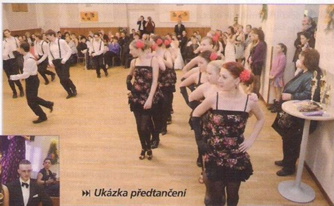
» Ukázka předtančení